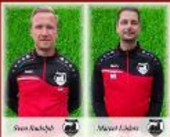
Trainer der Jahrgänge 2016/2017