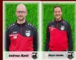
Trainer des Jahrgangs 2011