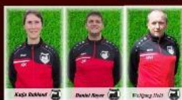
Trainer des Jahrgangs 2012