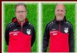
Trainer der Jahrgänge 2014/2015