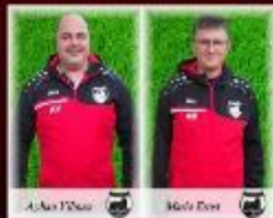
Trainer des Jahrgangs 2013