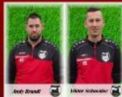
Trainer des Jahrgangs 2010